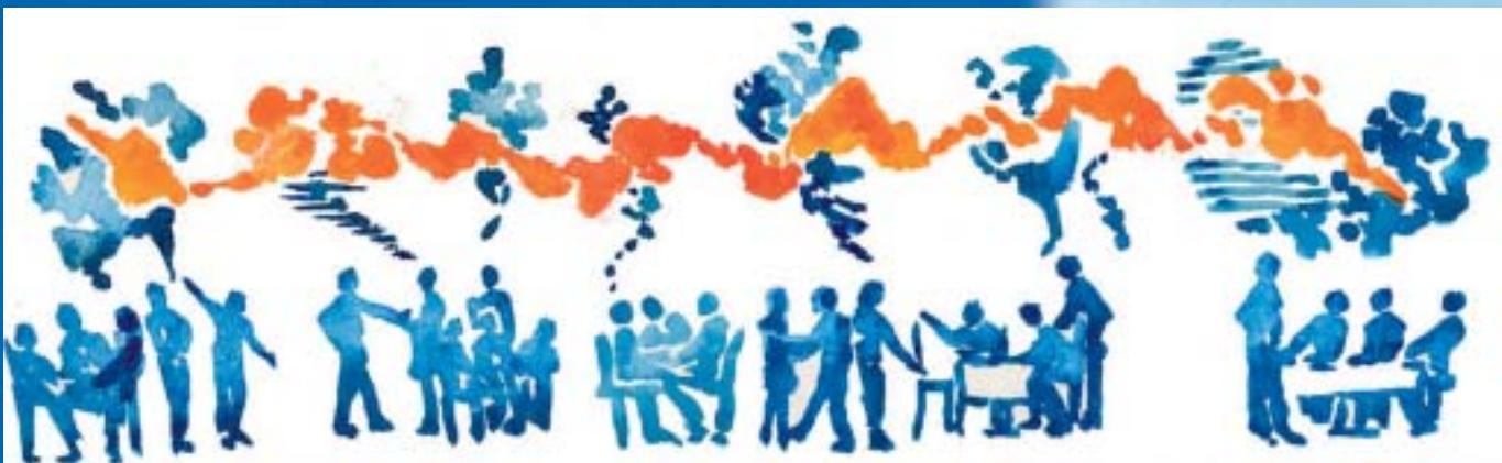
Abbildungen: www.theworldcafe.com Artwork „The World Café“ by Nancy Margulies